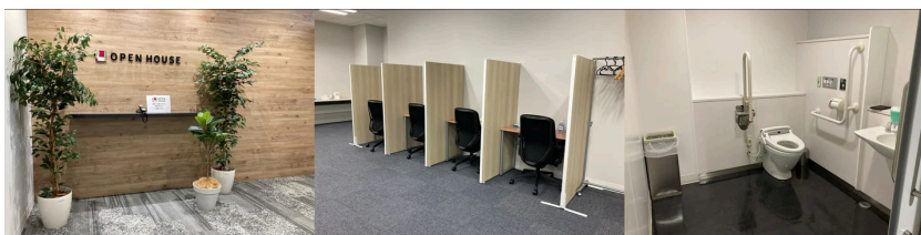
バリアフリー等の工夫が施された、オフィスの様子

また、2025年7月15日付で東京労働局より、障害者雇用相談援助事業者の認定を受けるとともに、昨年は東京都の「障害者雇用エクセレントカンパニー賞 東京都知事賞」の受賞や、厚生労働省の「もにす認定」も取得いたしました。