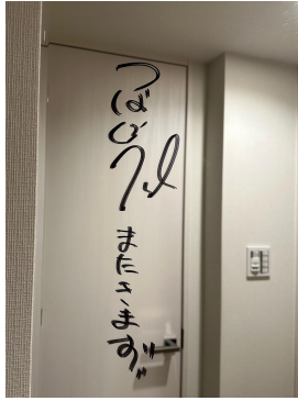
鏡に書かれたメッセージ