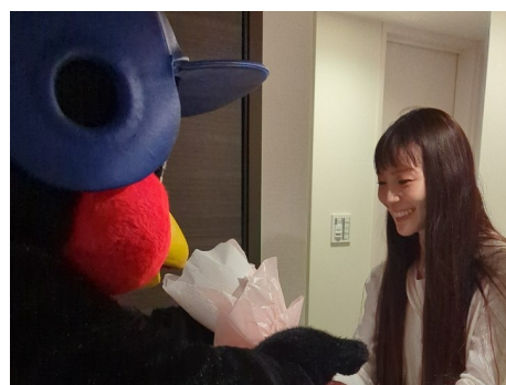
思わず笑顔がこぼれるK様